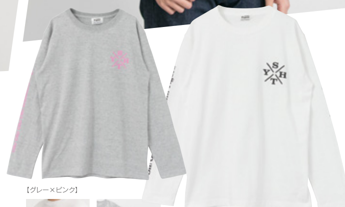
【ホワイト×ブラック】