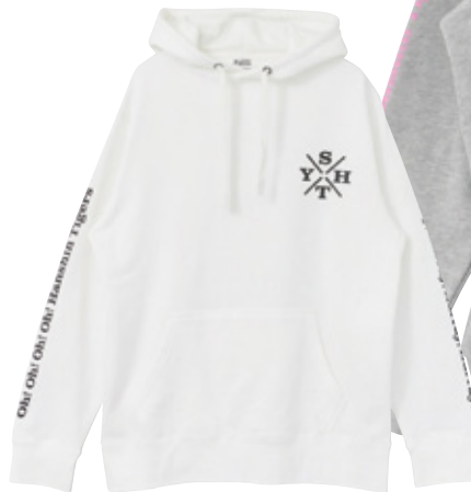
【ホワイト×ブラック】

「Suki Yanen Hanshin Tigers」を表現した、左胸のワンポイントロゴが光るパーカー。両袖には「六甲おろし」のフレーズが。