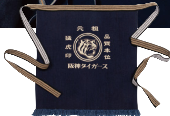
1 猛虎印 デニム帆前掛け

税込 ¥3,132 (本体価格 ¥2,900) □サイズ: 約39×36×12cm □素材: 綿 ORIGINAL