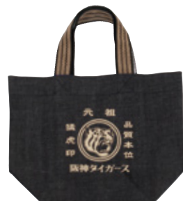
4 猛虎印 デニムランチバッグ

税込 ¥3,888 (本体価格 ¥3,600) □サイズ: 約28×23×5cm □素材: 綿 ORIGINAL