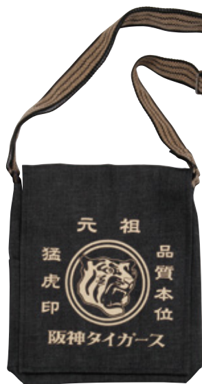
3 猛虎印 デニム ショルダーバッグ

税込 ¥2,484 (本体価格 ¥2,300) □サイズ: 約22×18×2cm □素材: 綿 ORIGINAL