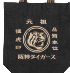
5 猛虎印 デニムレトロバッグ

税込 ¥2,484 (本体価格 ¥2,300) □サイズ: 約24×33×12cm □素材: 綿 ORIGINAL