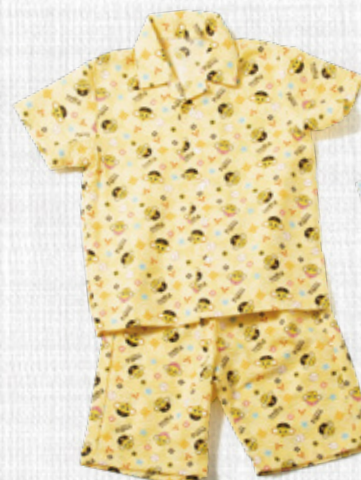
5 半袖シャツ・パンツ

税込 ¥4,212 (本体価格 ¥3,900) □種類: イエロー・ブルー・ピンク □サイズ: 110・130 □素材: 綿