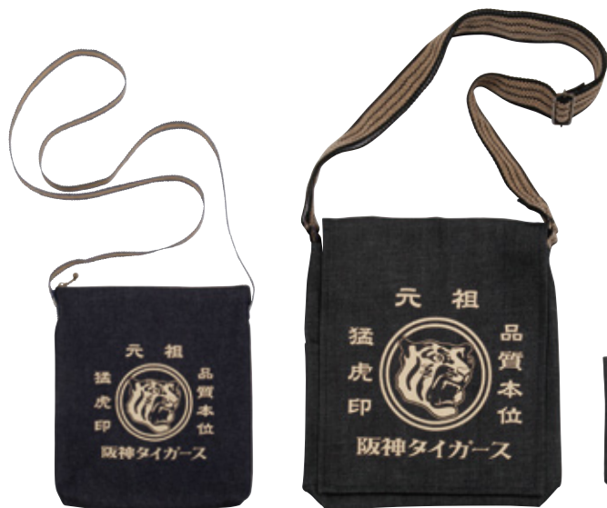
2 猛虎印 真田紐デニム ショルダーバッグ

猛虎印のタイガースデニムグッズが登場! デニム生地なので耐久性に優れ、また年月をかけて使い込むにつれて、愛着が増すこと間違いなし!