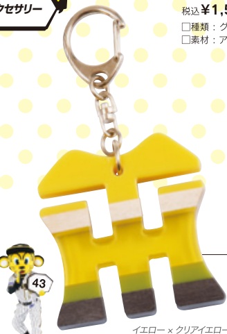
イエロー × クリアイエロー

税込 ¥1,512 (本体価格¥1,400) ORIGINAL □サイズ：全長約3.5cm □素材：ポリエステル・合金・真鍮・チタンポスト