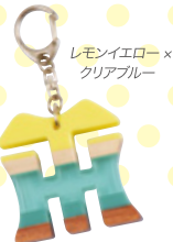
レモンイエロー × クリアブルー