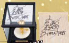
箱とケースには トラッキーのサイン入り!!