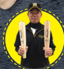
福留選手モデル 2018年使用同型バット