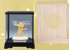
桐箱・ケース入り