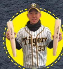
糸原選手モデル 2019年使用予定バット